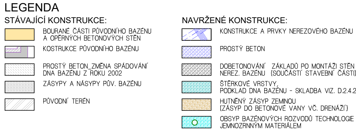
SO 02_ŘEZ PODÉLNÝ_STAV