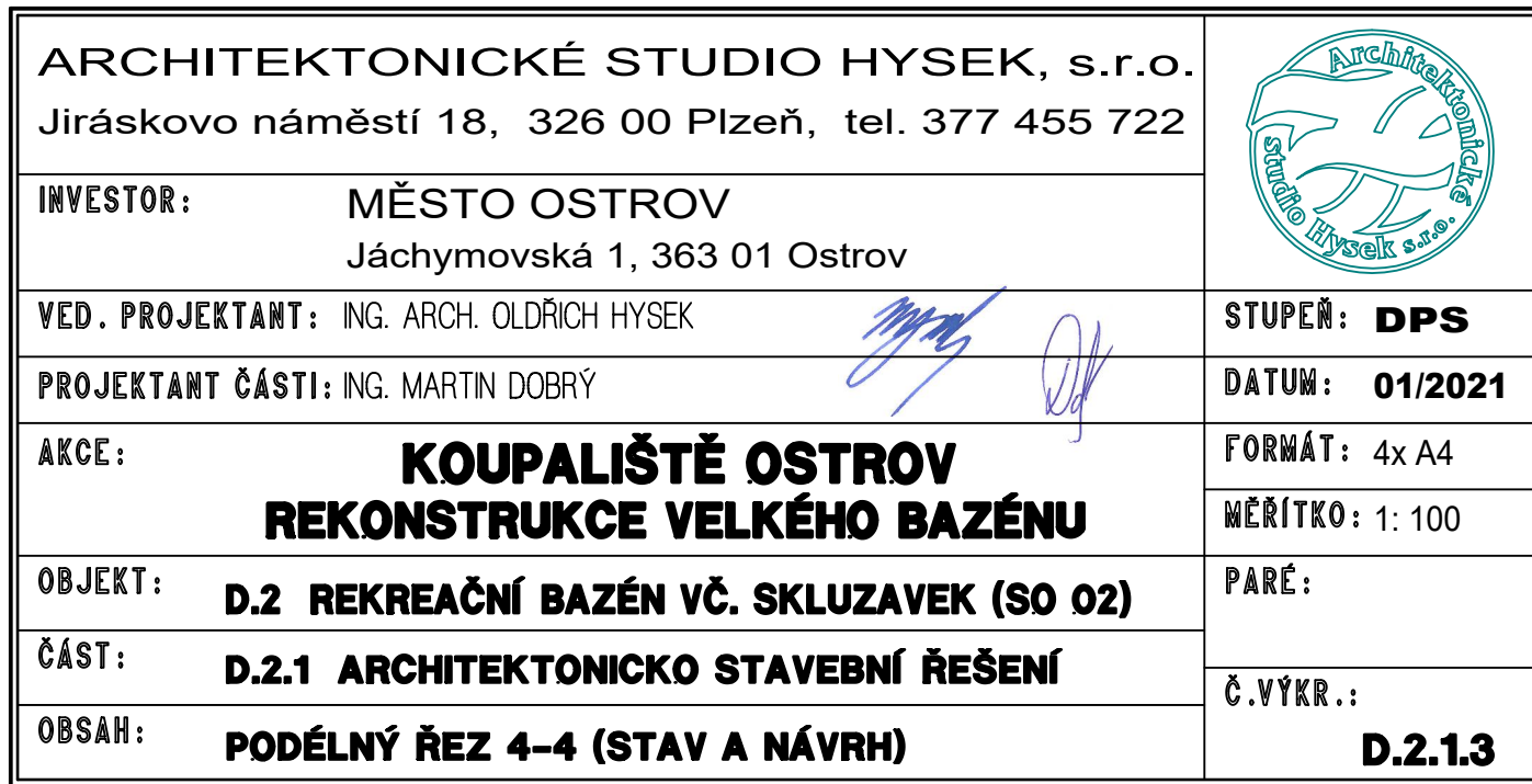
SO 02_ŘEZ PODÉLNÝ 4-4_NÁVRH

+ 0,000 = 431,190 (HLADINA VODY REKREAČNÍHO BAZÉNU)